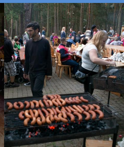
Grille i ogniska