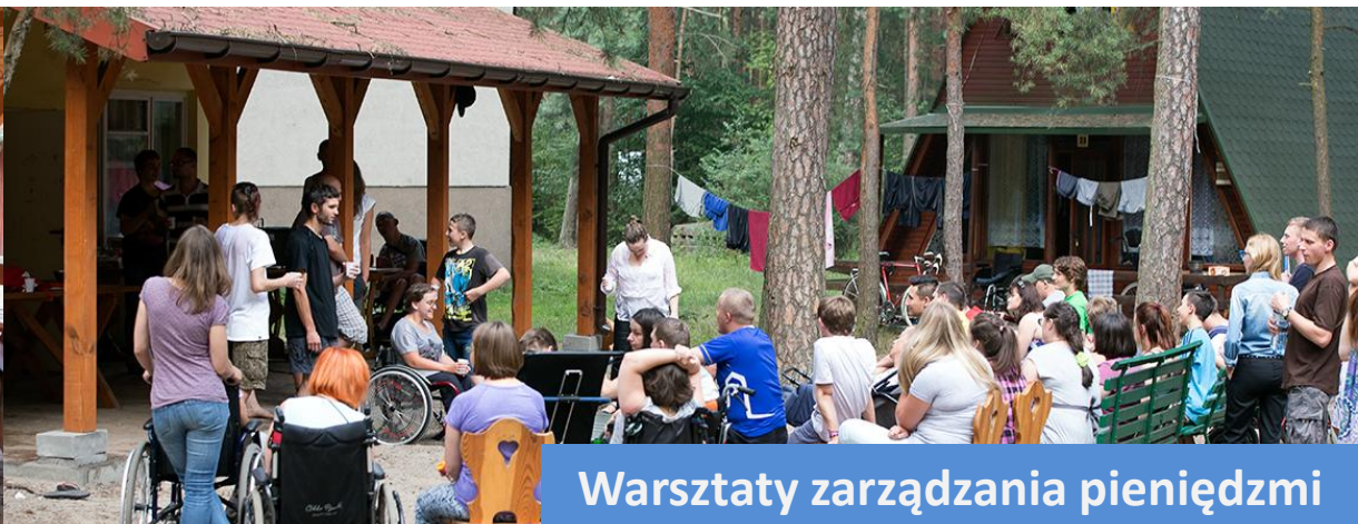
Warsztaty zarządzania pieniędzmi