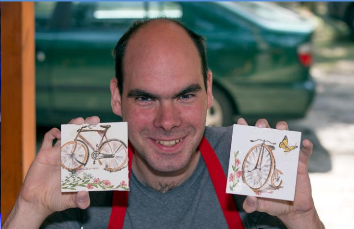
Warsztaty z decoupage