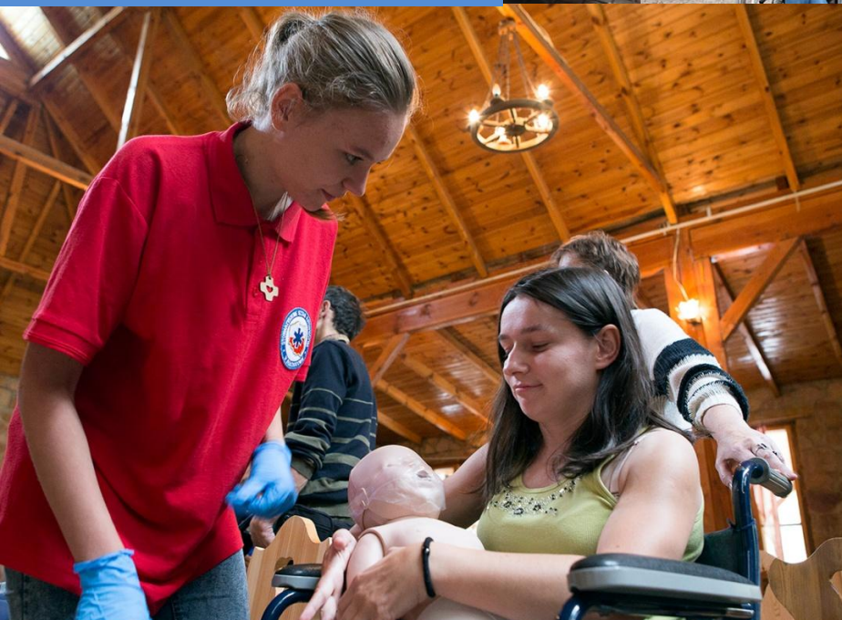
Warsztaty z pierwszej pomocy medycznej