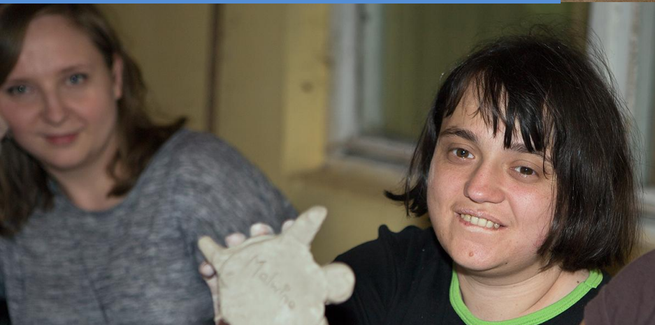
Warsztaty z ceramiki